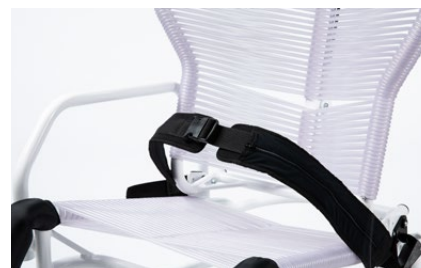
894 Cintura pelvica a 45°