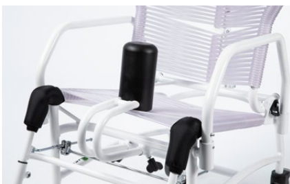
834 Cuneo divaricatore regolabile in profondità.